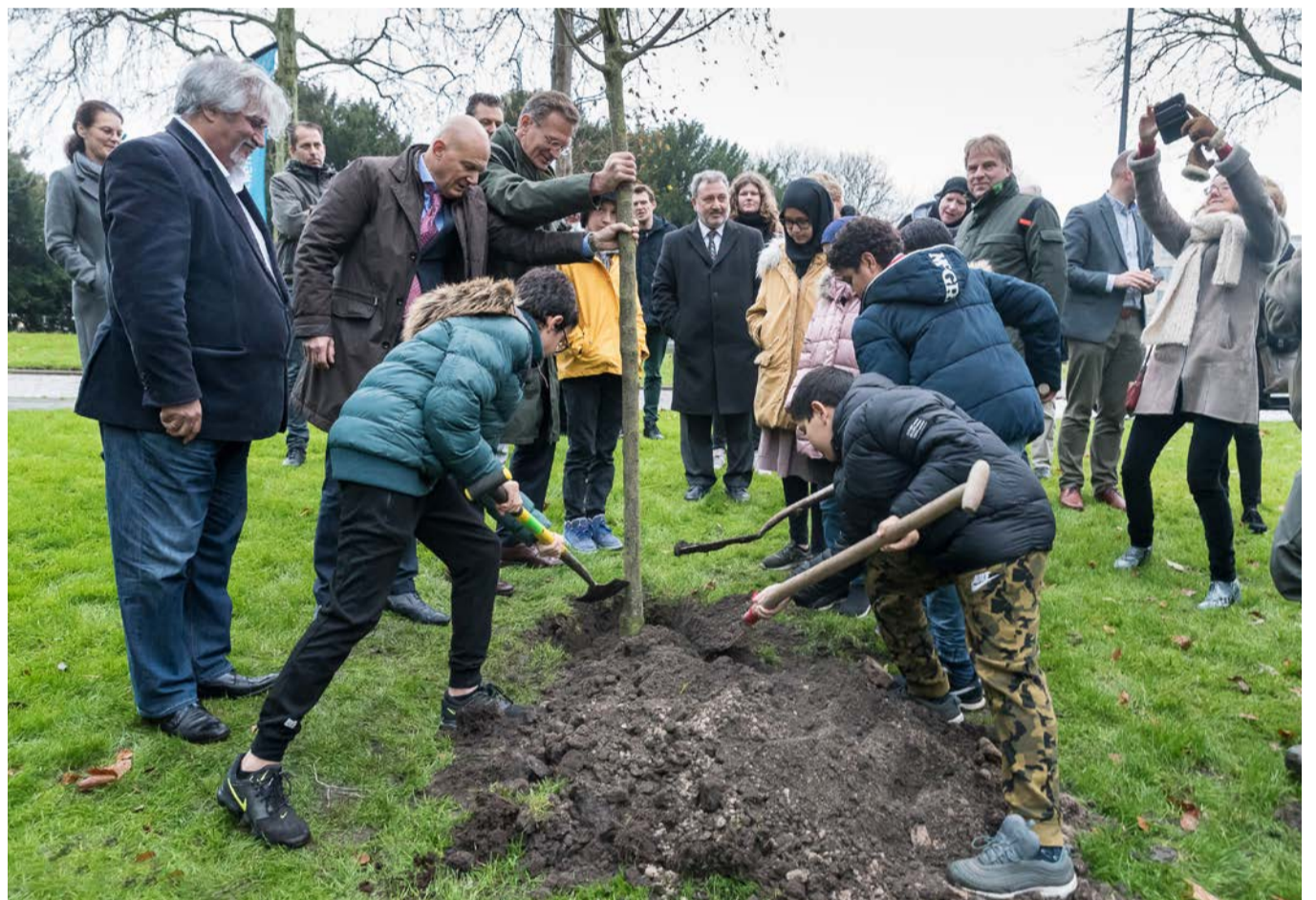
Kinderen van basisschool IBS Noen planten de eerste kroosboom in de Crooswijksebocht.