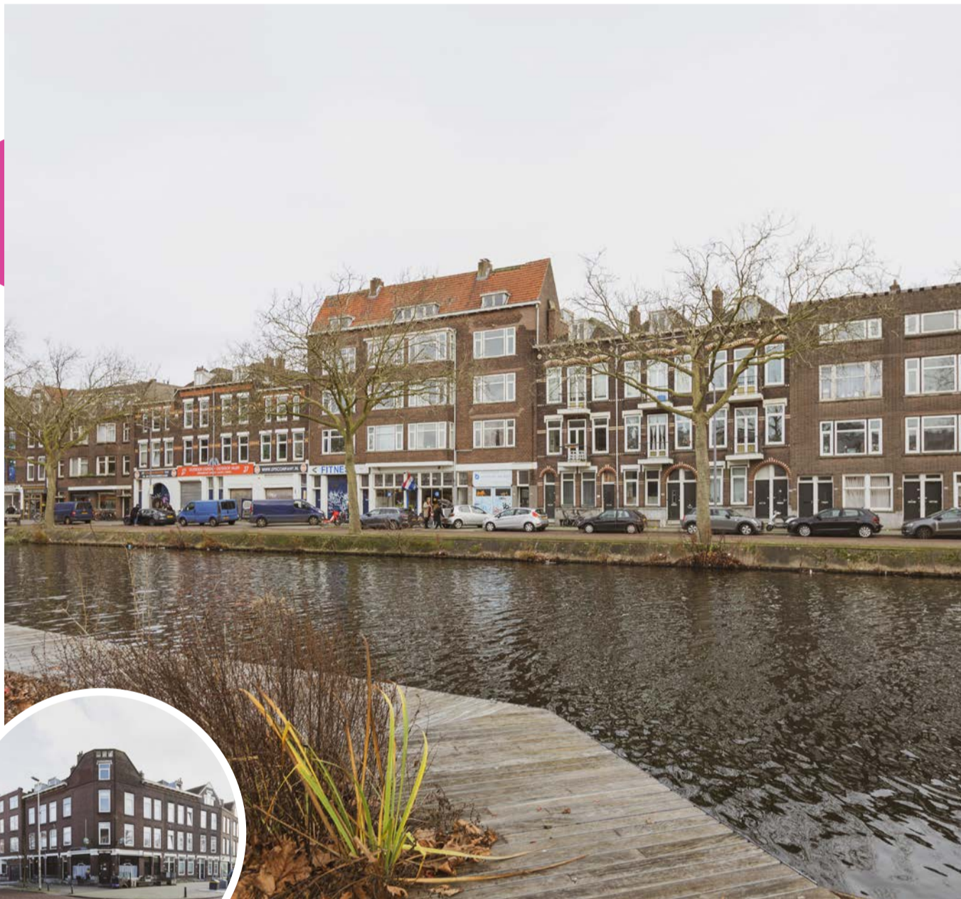
De Linker Rottekade vanaf de Zwaanhalskade.

Op de Linker Rottekade willen we zorgen voor een plek waar alle bewoners van Nieuw Crooswijk ook kunnen ontspannen en inspennen. We zorgen voor verschillende winkels, horeca en sportmogelijkheden. Kanoën, een terrasje pakken of even de boodschappen halen; dat is de Linker Rottekade van de toekomst. Samen met de gemeente Rotterdam en met Stichting Plezierrivier De Rotte maken we dit mogelijk. Met de bestaande ondernemers praten we over hun wensen en de mogelijkheden.