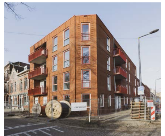
Links de Schuttersstraat, rechtsboven werk in de Schuttersstraat en rechtsonder de nieuwbouw in de Rakstraat.