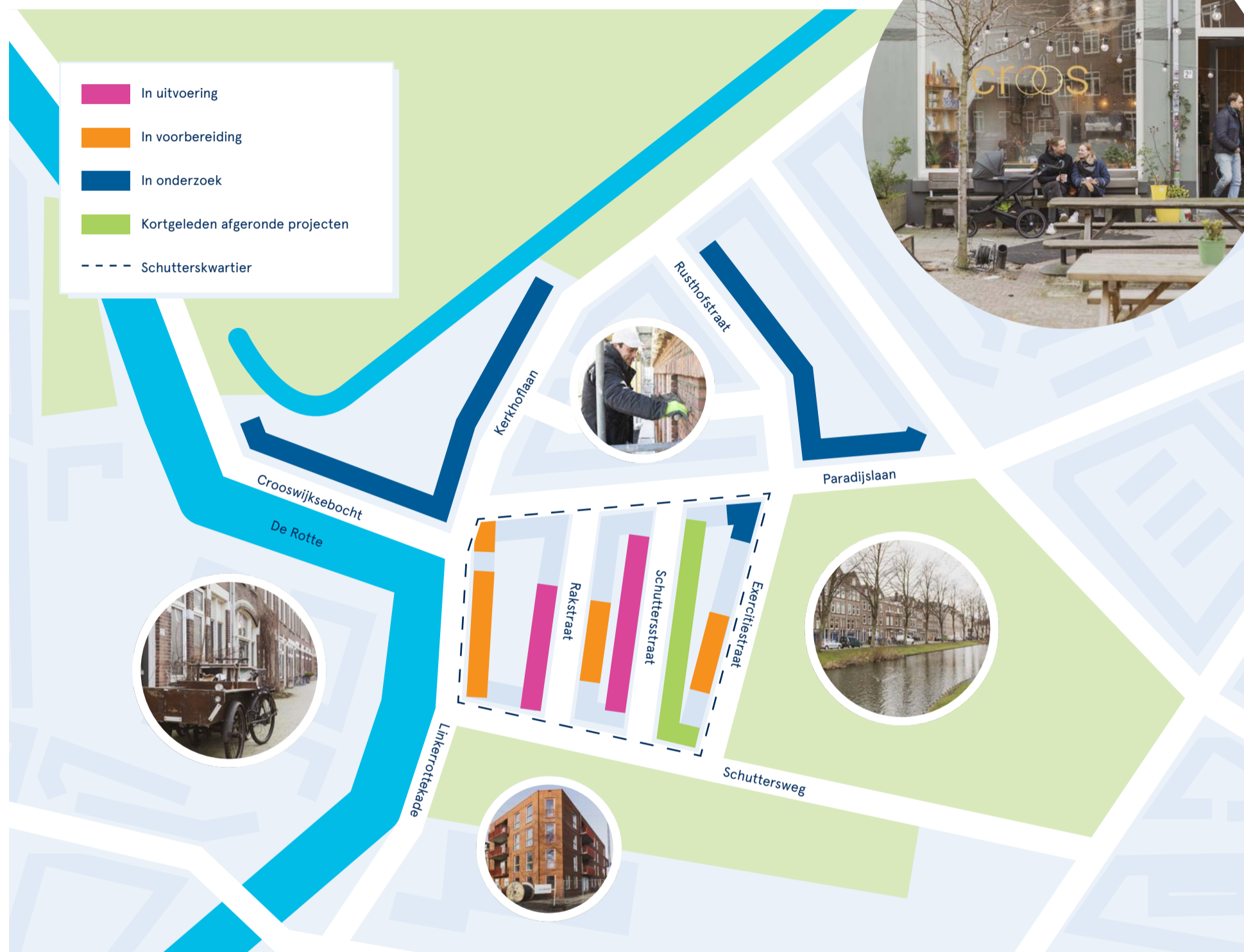
Plattegrond van een gedeelte van Nieuw Crooswijk met de plekken van de plannen en projecten.

Nieuws over de ontwikkelingen en het werk in de wijk – februari 2020